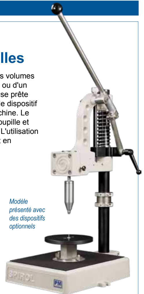
Modèle présenté avec des dispositifs optionnels

SPIROL propose aussi des machines automatiques.