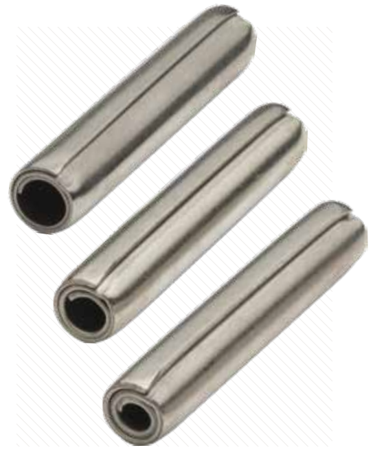
Les Goupilles Élastique Spirales sont proposées en version légère, standard et lourde pour répondre aux exigences spécifiques des applications

Bien que les Goupilles Spirales en acier inoxydable austénitique 302/304 offrent une excellente protection contre la corrosion, ce matériau n'est pas une solution appropriée lorsque la goupille est soumise à des charges dynamiques ou lorsque l'endurance doit être égale ou supérieure à celle de l'acier à haute teneur en carbone. Par ailleurs, l'acier inoxydable martensitique au chrome 420 offre, en plus de sa résistance inhérente à la corrosion, une combinaison exceptionnelle de solidité et d'endurance.